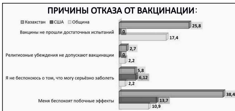
Рис. 4. Причины отсутствия вакцинации: сравнение данных

Подтверждением этого вывода может служить сравнение результатов нашего опроса с результатами исследования отношения общества к вакцинации в отдельных странах [1, с. 68], откуда были позаимствованы две шкалы вопросов. Сравнение наиболее популярных ответов наших респондентов с данными ответов иностранного исследования, по США и Казахстану, обладающими разными уровнями экономического развития дают следующие результаты (см. рис. 4).