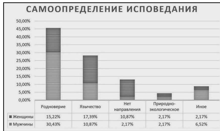
Рис. 1. Самоопределение своего языческого исповедания

Данные опроса демонстрируют, что на веру респондентов во время пандемии ковида не влияли ни время, проведённое в общине, ни направление вероисповедания. То есть, вне зависимости от любых факторов, вера сохранялась на допандемийном уровне. Для большинства (80%) респондентов, пандемия не стала поводом для изменения религиозных воззрений.